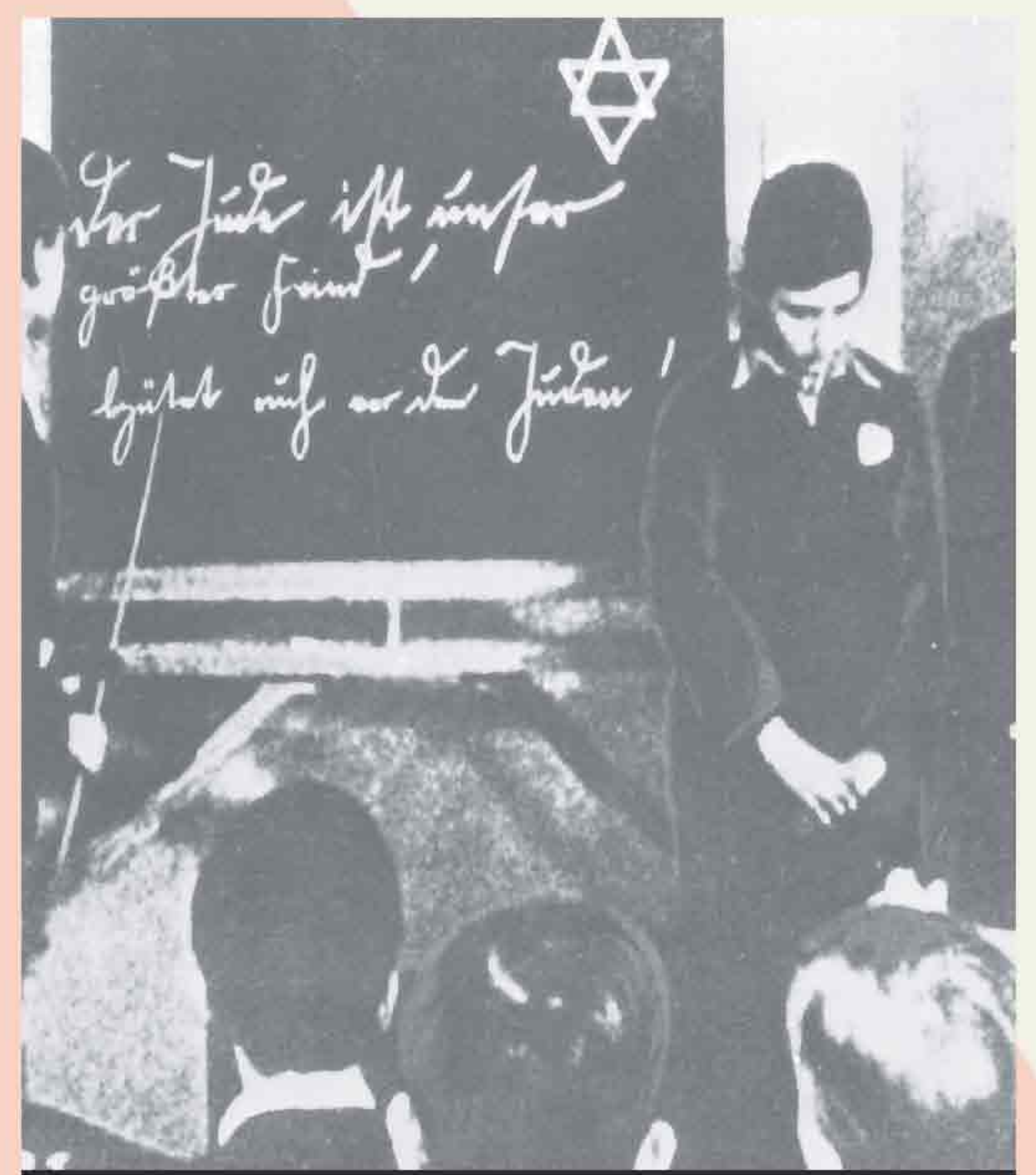
Jewish student humiliated in the Nazi-run schools of 1938. Blackboard reads, "The Jew is our greatest enemy Protect yourself from Jews."

Within a month of seizing power, in February of 1933, Hitler suspended all constitutional rights. The SS and SA began political arrests, brutalizing Jews, Communists, and any other of the Third Reich.