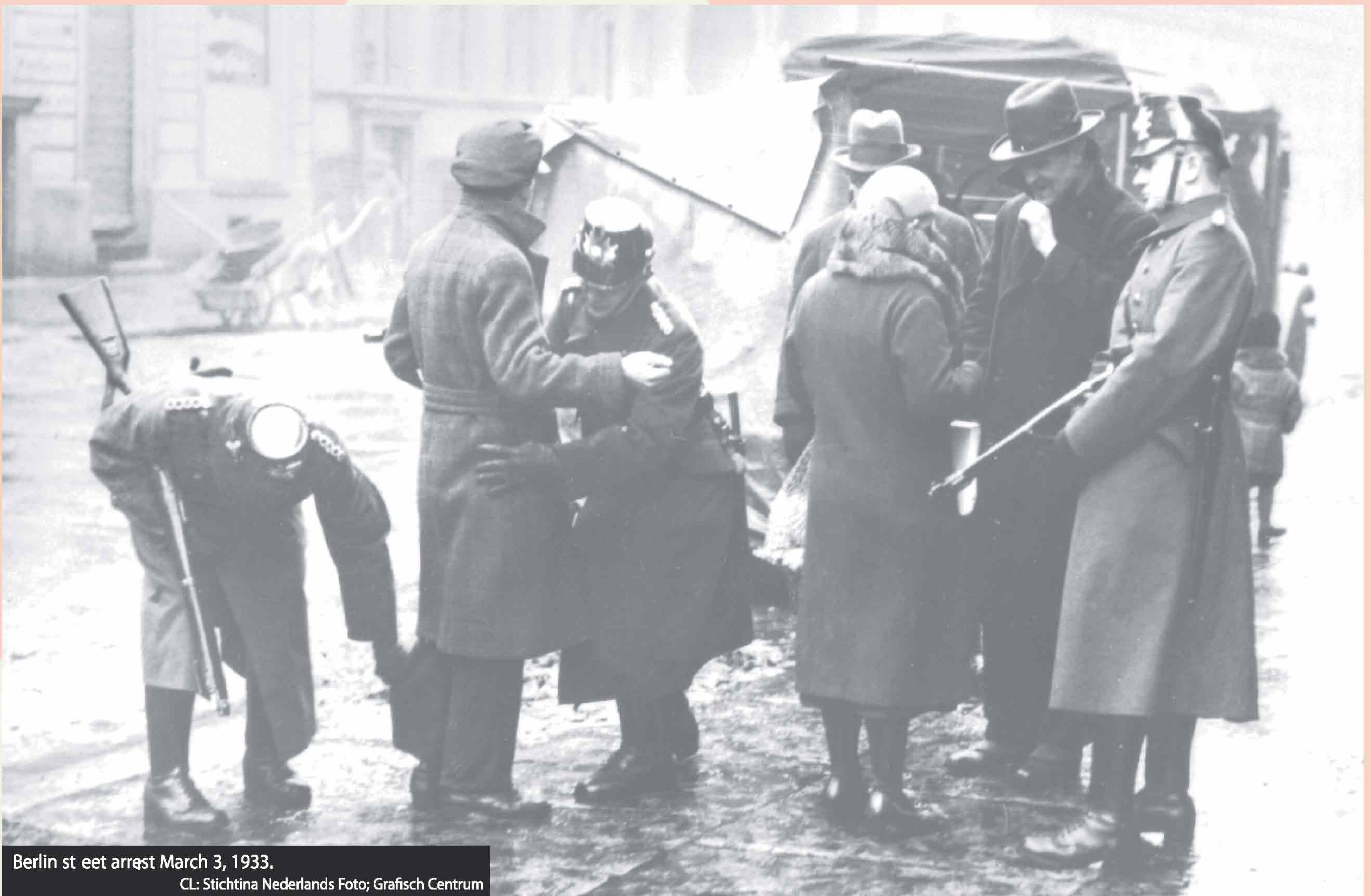
Berlin street arrest March 3, 1933.