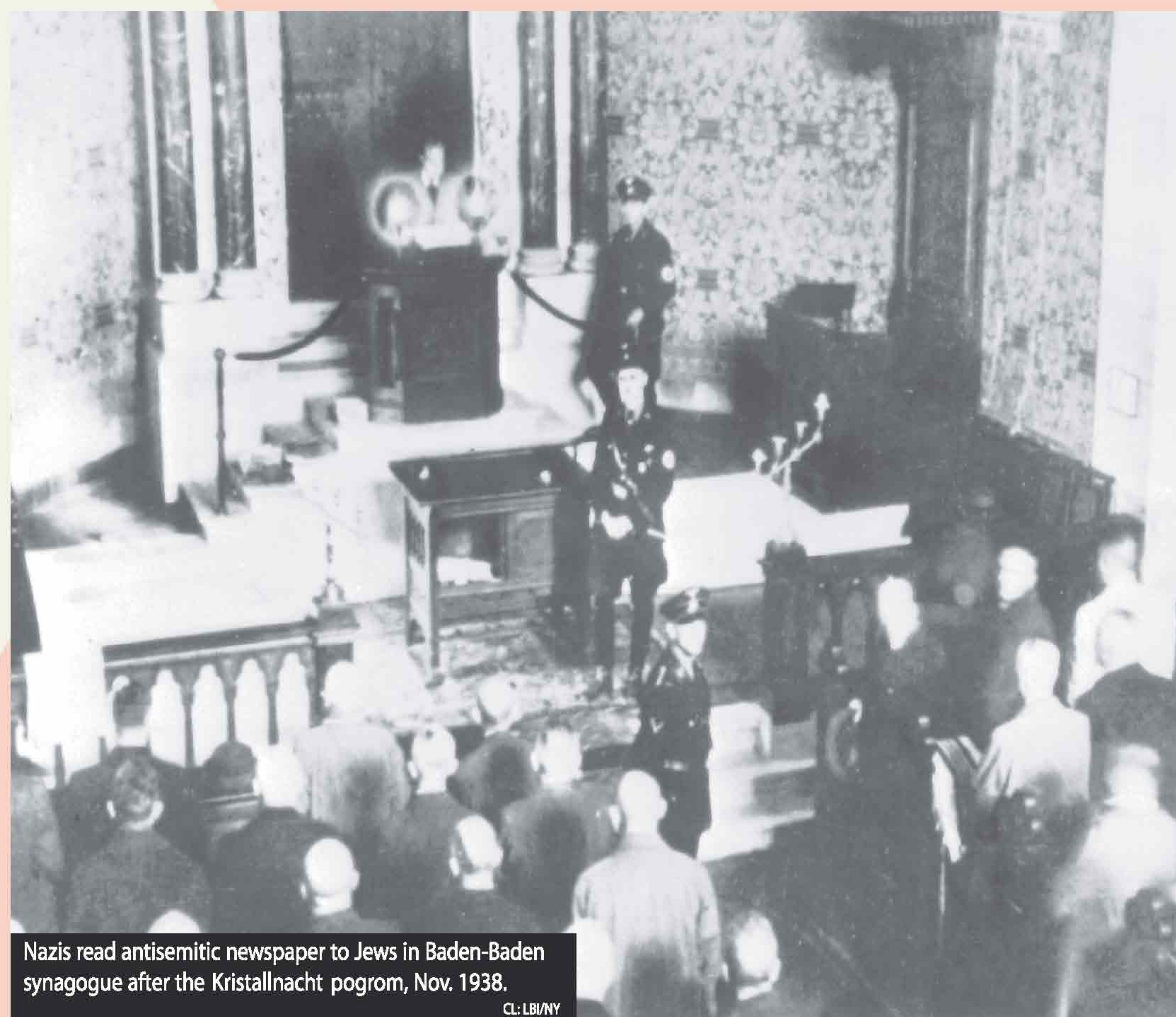
Nazis read antisemitic newspaper to Jews in Baden-Baden synagogue after the Kristallnacht pogrom, Nov. 1938.

"A house like millions of others, somewhere in Germany. Simple people, like you and me, live in this house; these people live in fear. Don't ask what they fear; they fear the Gestapo of course. They fear the rampant secret denunciations. Friends see someone ringing the doorbell at an unusual hour. The fear is there; doors open furtively and the intimidated residents peek out to see who is affected."